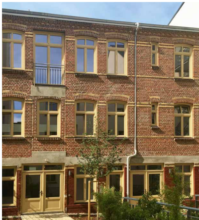
DAS HIPS IN DER HAMBURGER KAROLINENSTRASSE